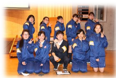
～工夫を凝らしたMVコンテスト～