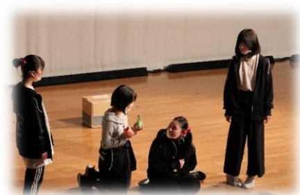
～本番でもマスクやシールドをしました～

11月7日土曜日午後13:30から、小ホールにて中学校演劇部による「自主公演」がありました。作品名は「See you...」で、内容は、「演劇を愛している4人が作った小劇団。けれど、愛だけじゃ夢は続かない。今日限りで解散の運命にある劇団の部屋で彼女たちは、それぞれに何を想うのか」と、自分たちの等身大の思いを芝居にしました。夏休み以降、小礼拝堂、技術家庭科室、野外ステージなどいろいろな場所で練習してきた成果が発表出来ました。